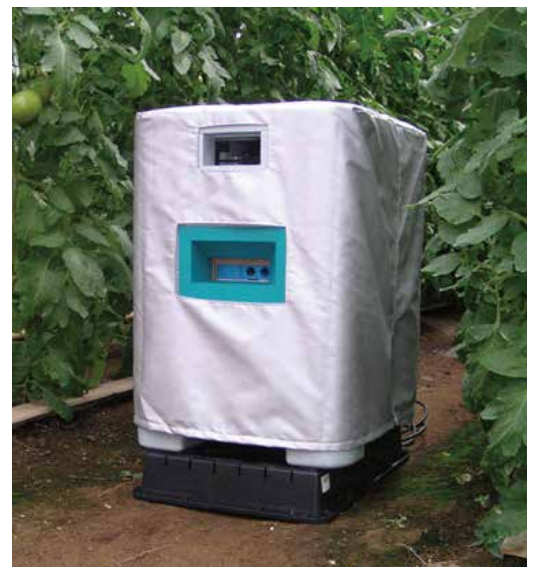
アグリセクトてきおん君特殊保護カバー (別売品)をかぶせた状態

※アグリセクトてきおん君特殊保護カバーをかぶせることで、紫外線による本体の劣化を防ぐことができます。