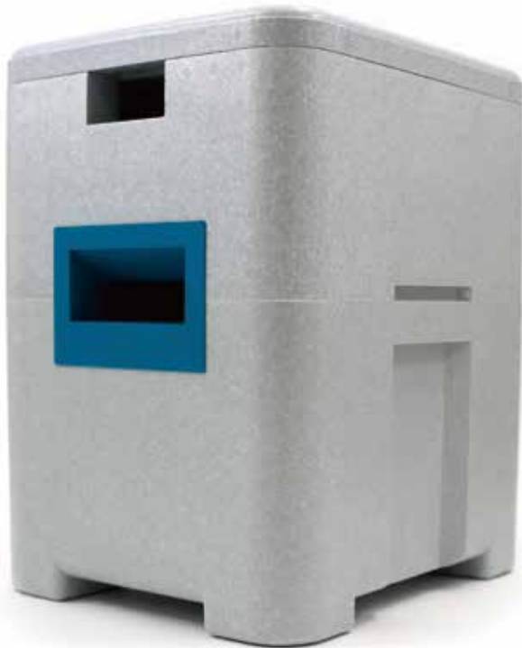
アグリセクトてきおん君

アグリセクトてきおん君は、外気温に応じて冷暖房機能が作動することで、時季を問わずにマルハナバチの巣をもっとも快適な温度にする恒温箱です。