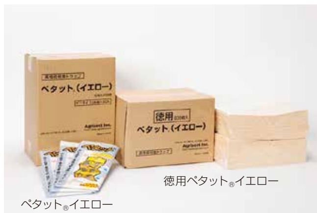
ペタット®イエロー