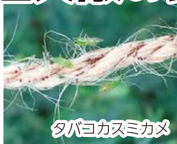
タバコカスミカメ