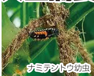
ナミテントウ幼虫