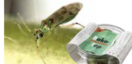
バコトップ（商品外観）

H28年～H30年 戦略的イノベーション創造プログラム（次世代農業水産業創造技）「持続可能な農業生産物のための新たな総合的植物保護技術の開発」での開発品