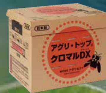
アグリ・トップ®クロマル DX