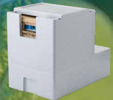
アグリ・トップ® まるはな冷すばこ