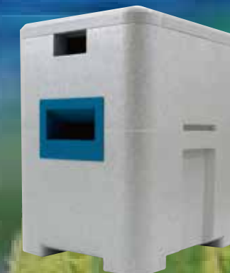
アグリセクトてきおん君