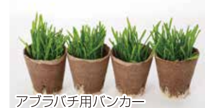
アブラバチ用バンカー

大型捕食性天敵の圃場での分散を促し、かつ餌となるブラインシュリンプ耐久卵が付いた天敵用補助資材【特許 第6893118号】