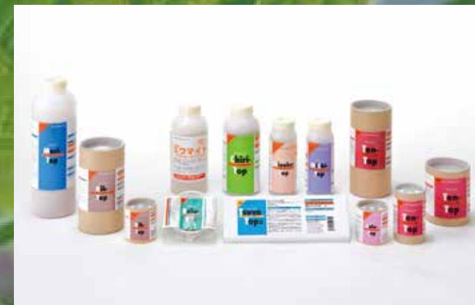
天敵製剤トップシリーズ