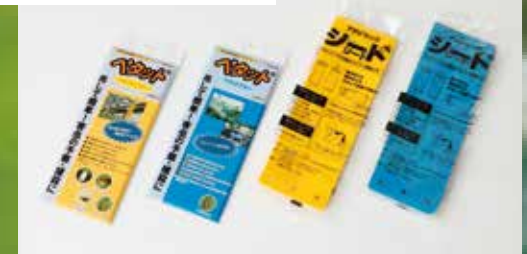
害虫誘引捕虫資材