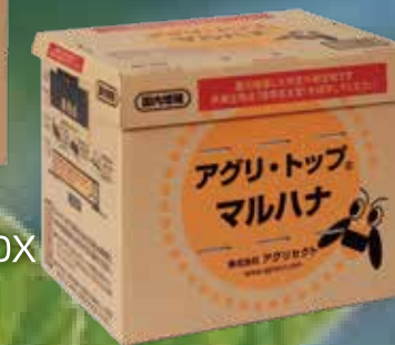
アグリ・トップ®マルハナ