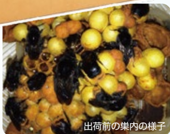
出荷前の巣内の様子